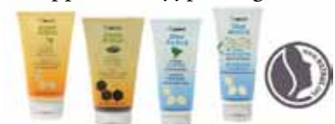
Sauna Arctica • Silva Arctica

Asiakkaat, joilla on taipumusta atooppisen ihotyypin ongelmiin,